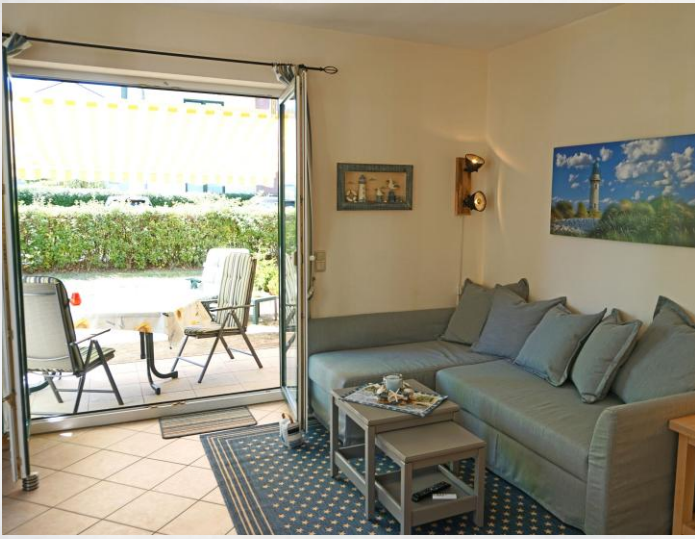
Im Wohn-/Esszimmer stehen TV, DVD-Anlage + Radio für lange Abende zur Verfügung.

Zur 54qm großen gemütlich ausgestatteten EG-Wohnung gehört ein PKW-Abstellplatz und Fahrradstellplätze. Wlan gratis!