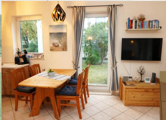
In der, in den Wohn-/Essraum integrierte komfortablen, Küche werden Sie die besten Essen zaubern. Selbstverständlich finden Sie hier eine Spülmaschine, Kühl-/Gefrierschrank, Microwelle,... etc....